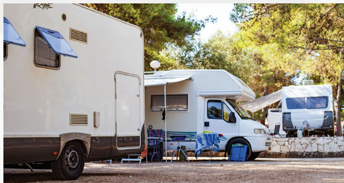
Los vehículos recreativos se consideran casas móviles durante las evacuaciones.